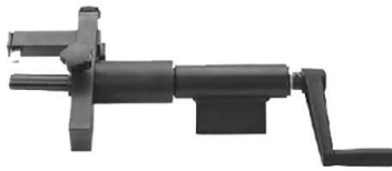
SRM - SRIM